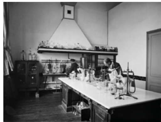
Laboratoire du Professeur de technologie L'Institut Agro Rennes-Angers Début XX e siècle

Le grand public y découvre ces témoignages de près de deux siècles d'enseignement des sciences et techniques de l'agronomie.