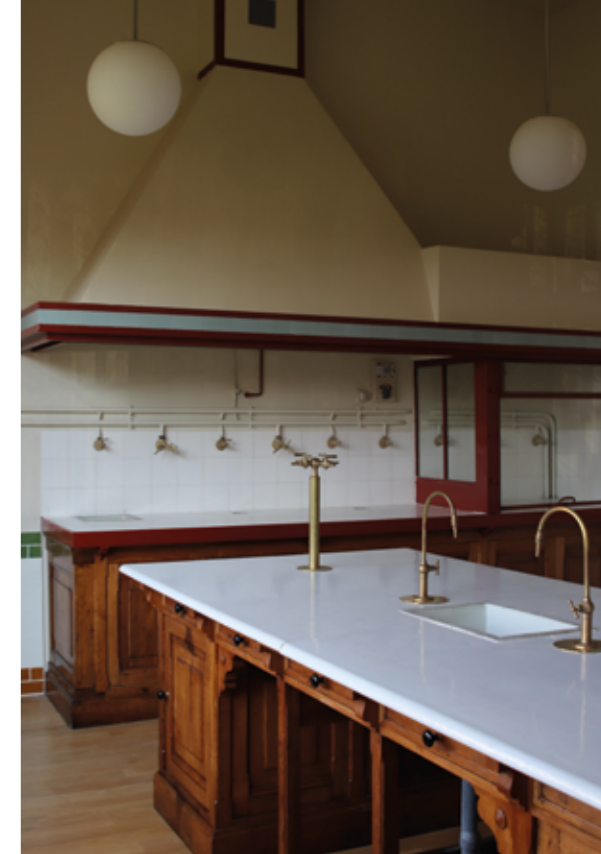
Cette même salle, « après réhabilitation » devenue espace d'exposition L'Institut Agro Rennes-Angers 2023