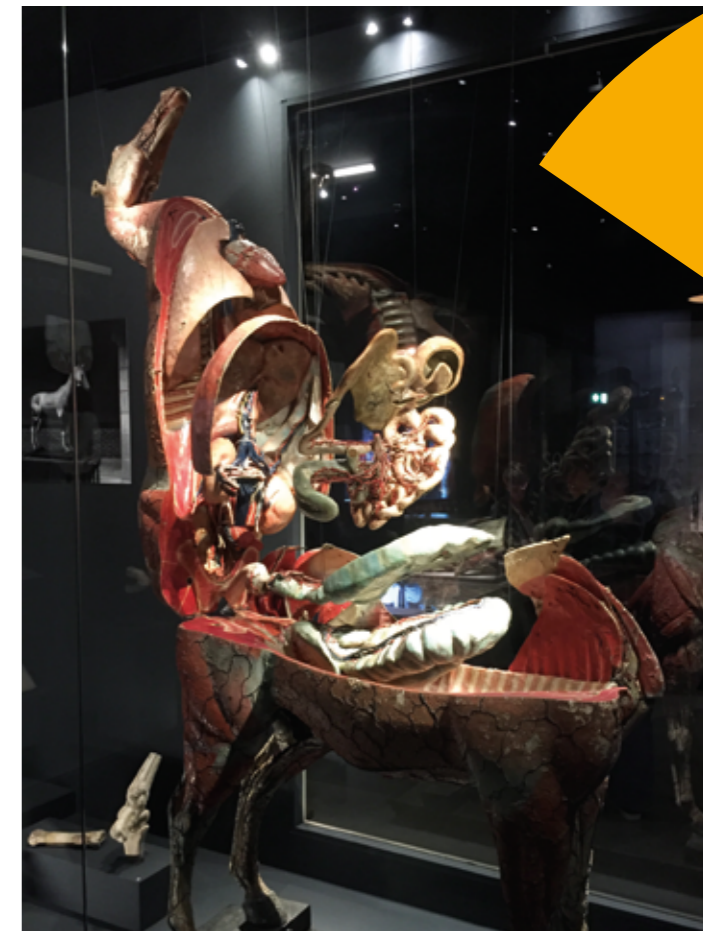
Cheval Auzoux (présenté ouvert avec ses organes internes) Photo Écomusée Rennes 2022

Il revient à Rennes, entre décembre 2021 et septembre 2022, pour l'exposition temporaire « La nature pour modèle », à l'Écomusée de La Bintinais.